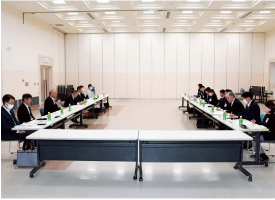
▲議論を交わす市職員とJA役職員

JAは今後も行政機関との連携を強化し、将来にわたる食料の安定供給と地域農業の維持・発展に向け、積極的な支援に取り組んで参ります。