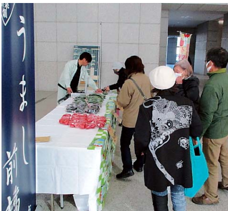
▲前橋産新鮮野菜をPR

また、JA前橋市は会場内に前橋産野菜の直売ブースを設置し、販売部園芸販売促進課の職員が新鮮なトマト、キュウリ、ナスを販売しました。販売開始前から購入希望者が訪れるなど大好評で、前橋市自慢の高品質な野菜をPRしました。