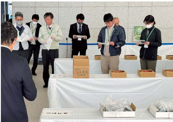
▲高品質な出品物の数々に困難を極めた審査