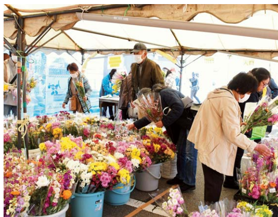
▲来客者で賑わう花の売り出し

産直ゆうあい館は、3月17日から21日までお彼岸セールを行いました。セール期間中は、産直部会に所属する生産者が丹精して育てた花を直売所駐車場に設置したテントで販売しました。小菊・ユリなど各種の花が並び、お彼岸のお墓参りのためにと花を求める多くの来客者で賑わいました。