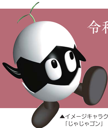
▲イメージキャラクター 「じゃじゃゴン」

卯月/卯の花 (空木の花) の盛りの季節 花暦/桜…精神美 誕生石/ダイヤモンド…清浄・無垢