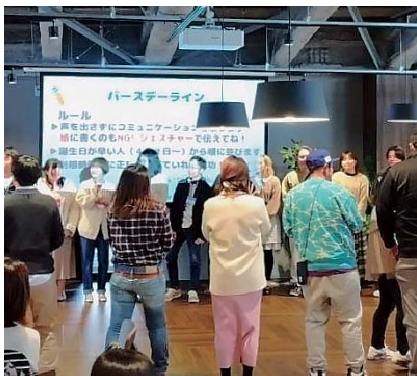
▲アクティビティを通じて交流を深める参加者

当日は20代〜40代の男女52人が参加し、農業に関する〇×クイズや、新鮮な野菜と上州牛まえばしのステーキなどを堪能できるビュッフェを実施。参加者同士地域農業への理解を深めながら、和気あいあいと交流を楽しみました。結果として、6組のカップルが成立。更なる交流の機会として、市内生産者協力のもと、いちご狩り体験の特典が用意されました。