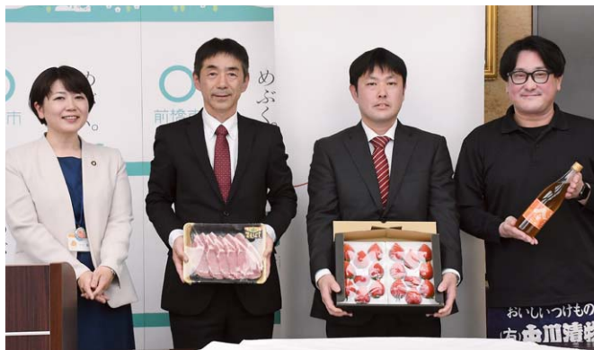
▲新たに認証を受けたまえばし麦豚⑤ 苺屋たくみのいちご⑥ (有)中川漬物の梅シロップ⑥

「まえばし麦豚」は、市内の赤城南麓の恵まれた自然環境の中で健康に育てられた肉豚。魚粉などの動物性飼料を使用せず、大麦を多く含む専用飼料を与えて育てることで、ビタミンB1を豊富に含み、豚特有の臭みを抑え、脂肪分の甘みとクセのないあつさりした風味が特徴です。