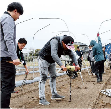
▶オーガで穴開け作業を実践する参加者

J A 前橋市は今後も研修会や現地巡回指導を継続的に実施し、生産者支援を強化していく方針です。