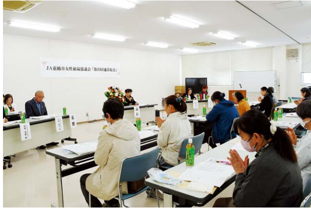
▲議長の進行により全議案が慎重に審議されました

J A 前橋市女性組織協議会は4月23日、J A アグリサポートセンターで第33回通常総会を行いました。