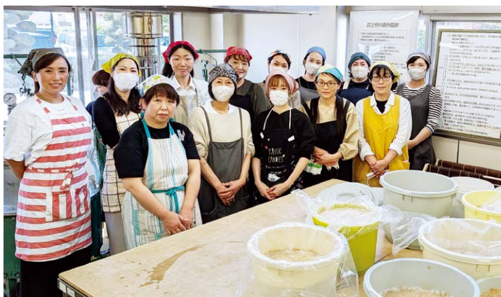
▲みそ作りに励んだ部会員

J A前橋市フレッシュユミズ部会は3月14日から17日、前橋市地産地消センターでみそ作り講習会を開きました。地産地消の推進と部会員同士の親睦を深めることを目的とし、部会員20人が参加。前橋産の古米と大豆を使ったみそ作りに挑戦しました。