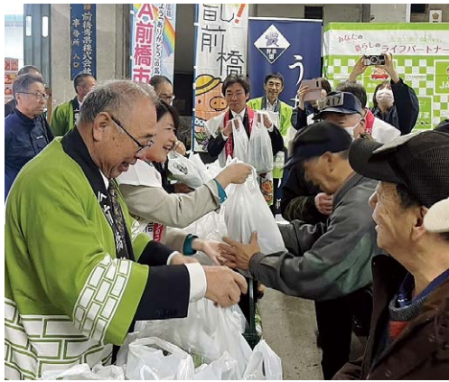
▲前橋産の新鮮野菜を市場関係者へPR

会場では、キュウリやナス、ズッキーニなど9品目を出展し、生産者が丹精込めて生産した前橋産野菜の品質の高さをアピール。買参人へ向けて野菜の展示やキュウリ・ナス・コマツナの詰め合わせを配布しました。