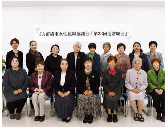
▲総会に臨んだ女性協役員

なお、女性組織協議会は16支部の女性部とフレッシュミズ部会、その他3つの組織（けやき工房、生命の貯蓄体操、百福会）で構成され、会員数は総会日現在で658名になります。