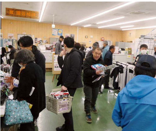
▲農業用資材を買い求める多くの来場者

また、日頃の感謝の気持ちを込めて、来場者に記念プレゼントを配付したほか、3,000円以上の購入者を対象とした大抽選会を行うなど、会場は多くの人で賑わいました。