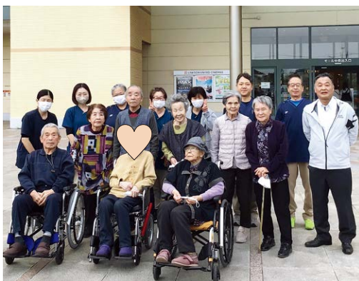
▲外出を楽しむ介護ホーム上陽の利用者

当日は、利用者が安心して外出できるよう、常時介護職員等がサポートにあたり、利用者は思い思いに食事や買い物を楽しみました。