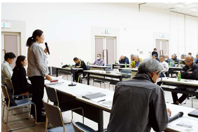
▲今作の水稲栽培について理解を深める参加者

当日は、県中部農業事務所や全農ぐんま職員、農薬メーカー関係者が令和7年産水稲作の振り返りや今年産水稲栽培の注意事項、水稲農薬の使用などについて詳しく説明しました。