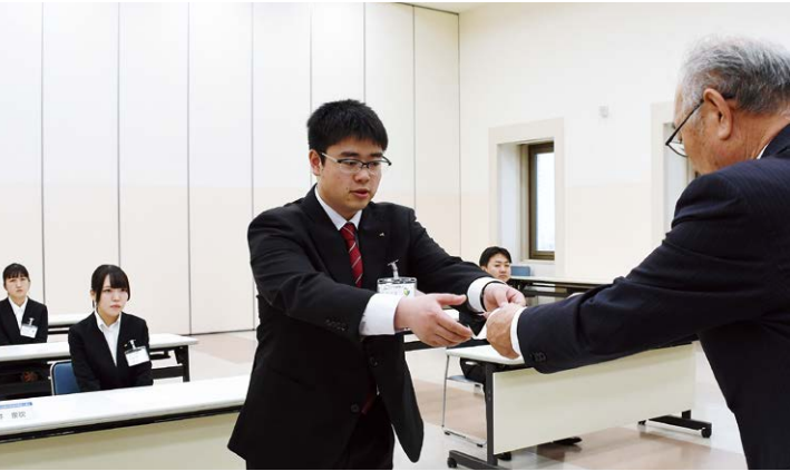
▶ 辞令を受け取る新入職員